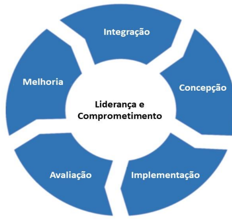
Estrutura da Gestão de Riscos ABNT NBR ISO 31.000:2018

Atualmente, a matriz de riscos passa por um processo de construção e compilação de informações, de forma a buscar obedecer a estrutura da gestão de riscos institucionalizada através da ABNT NBR ISO 31000:2018, conforme abaixo, senão vejamos: