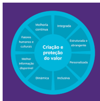
Princípios para o gerenciamento de riscos ABNT NBR ISO 31.000:2018

Nesse sentido, com base na ABNT NBR ISO 31000:2018, os princípios basilares previstos para o estabelecimento da estrutura e dos processos de gestão de riscos da organização serão continuamente observados, conforme disposto na figura abaixo: